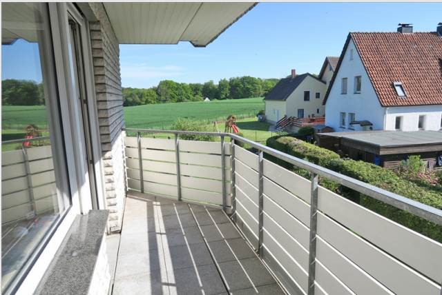
Renovierte, helle und moderne 2 Zimmer-Wohnung mit Süd-Westbalkon und Pkw-Stellplatz in Löhne-Gohfeld