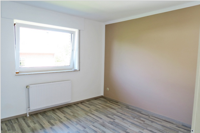
Renovierte, helle und moderne 2 Zimmer-Wohnung mit Süd-Westbalkon und Pkw-Stellplatz in Löhne-Gohfeld