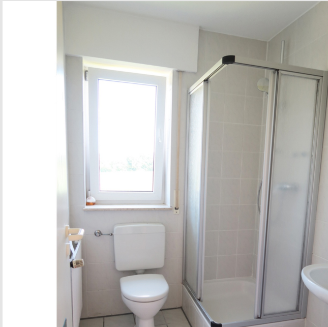
Renovierte, helle und moderne 2 Zimmer-Wohnung mit Süd-Westbalkon und Pkw-Stellplatz in Löhne-Gohfeld