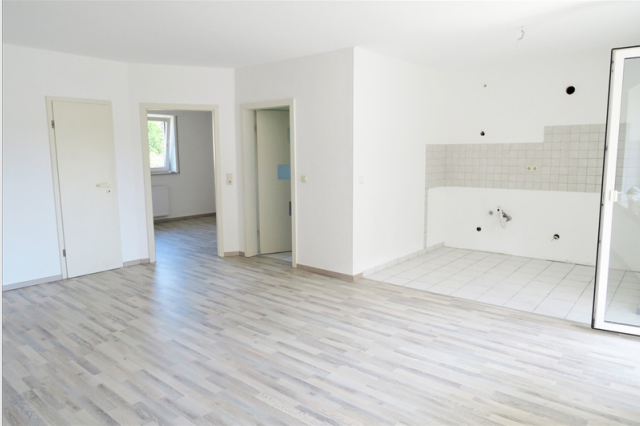
Renovierte, helle und moderne 2 Zimmer-Wohnung mit Süd-Westbalkon und Pkw-Stellplatz in Löhne-Gohfeld