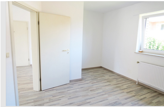
Renovierte, helle und moderne 2 Zimmer-Wohnung mit Süd-Westbalkon und Pkw-Stellplatz in Löhne-Gohfeld