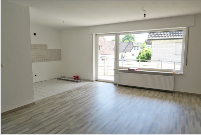
Renovierte, helle und moderne 2 Zimmer-Wohnung mit Süd-Westbalkon und Pkw-Stellplatz in Löhne-Gohfeld