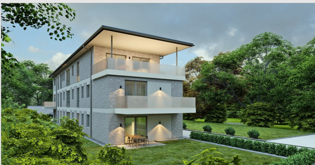
Exklusiver Neubau in Bad Oeynhausen - Innenstadt